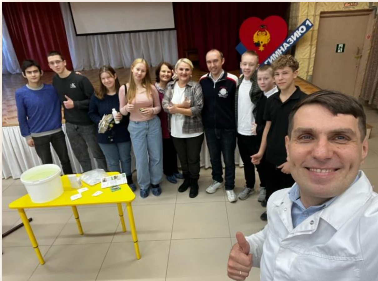
Команда «Твой выбор» учится у профессионалов: мастер-класс по гидропонике