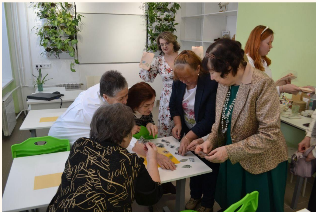
Международный женский день в новом Экоклассе. Ветераны-учителя гимназии активно включаются в любые затеи 07.03.2025

Для общества ветеранов: экомастер-классы от юных волонтеров: ✓«Украшение экомешочков/набивка», «Раздельный сбор мусора» ✓«Черенкование комнатных растений» ✓«Открытка из экобумаги/аппликация»