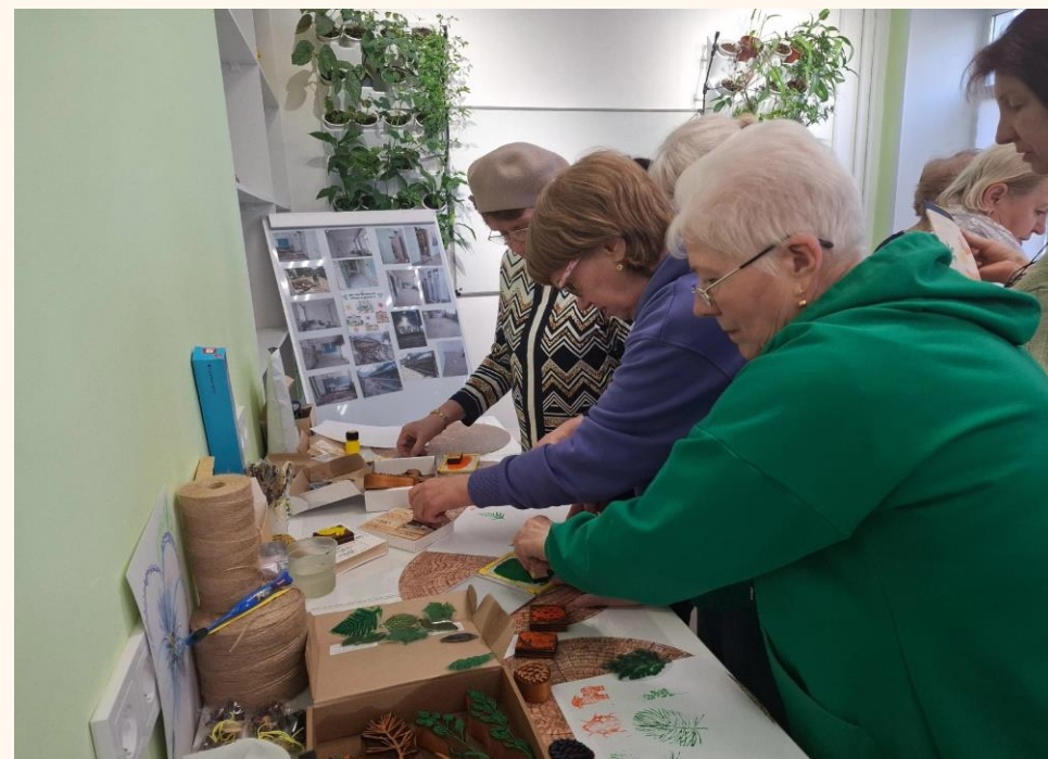
Мастер-класс «Украшение экомешочков/набивка»